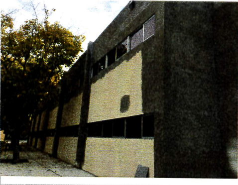
F3: Fachada posterior

Se trabaja en banquetas de obra exterior, instalación de difusores y rejillas de clima, herrería, instalación de cancelería interior y exterior, colocación de suspensión y placas de plafón reticular, en instalación de loseta y zoclo de cerámica en pisos y en muros de baños, se trabaja en 2da mano de pintura en muros interiores y primera mano muros exteriores, se trabaja en instalación de luminarias interiores y exteriores, contactos y apagadores.