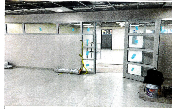
F5: Interior de aula 1